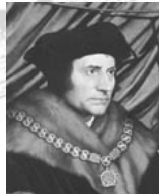
Utopisten aus verschiedenen Jahrhunderten: Platon, Thomas Morus und George Orwell (v. l. n. r.)

Kriegszeiten lebt, wünscht sich Frieden, wo staatliche Unordnung herrscht, wird Ordnung angestrebt. Je größer das Chaos, desto größer die Sehnsucht nach Struktur. So nimmt es auch nicht wunder, dass die überwiegende Zahl der Utopien der Vergangenheit ihr Streben darauf richtet, ein System zu erschaffen, welches Sicherheit und Geborgenheit vermitteln konnte, welches territoriale oder persönliche Grenzen zu schützen in der Lage war und welches Möglichkeiten bot, die Gesamtheit des sozialen oder wirtschaftlichen Zusammenlebens einer planvollen Kontrolle zu unterzie-